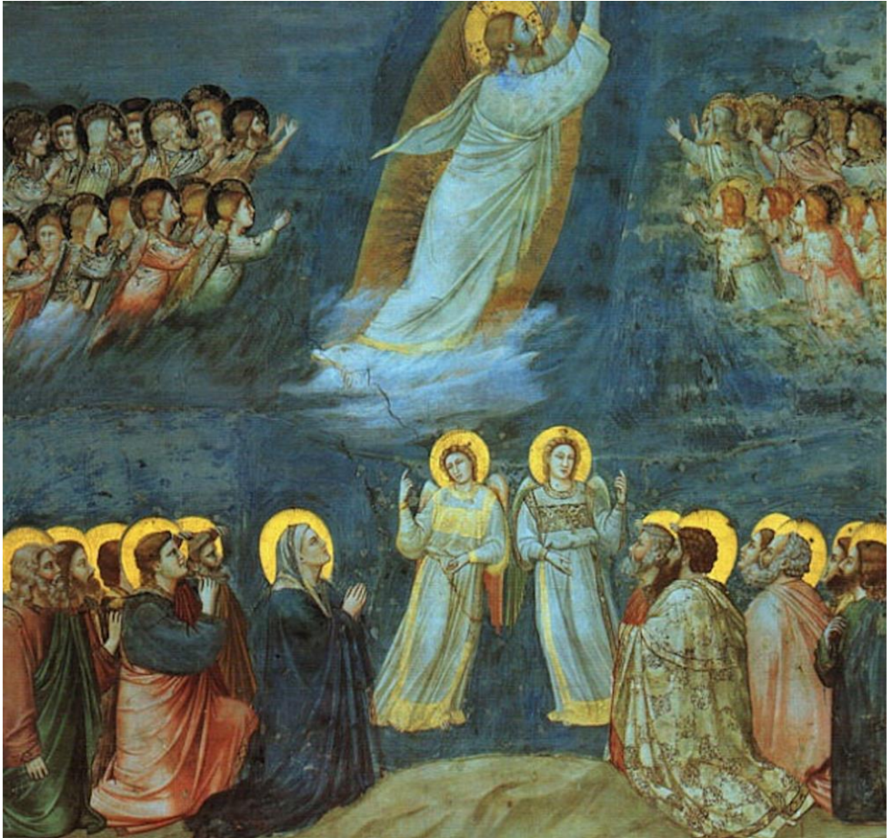
Giotto di Bondone, De hemelvaart, 1305.