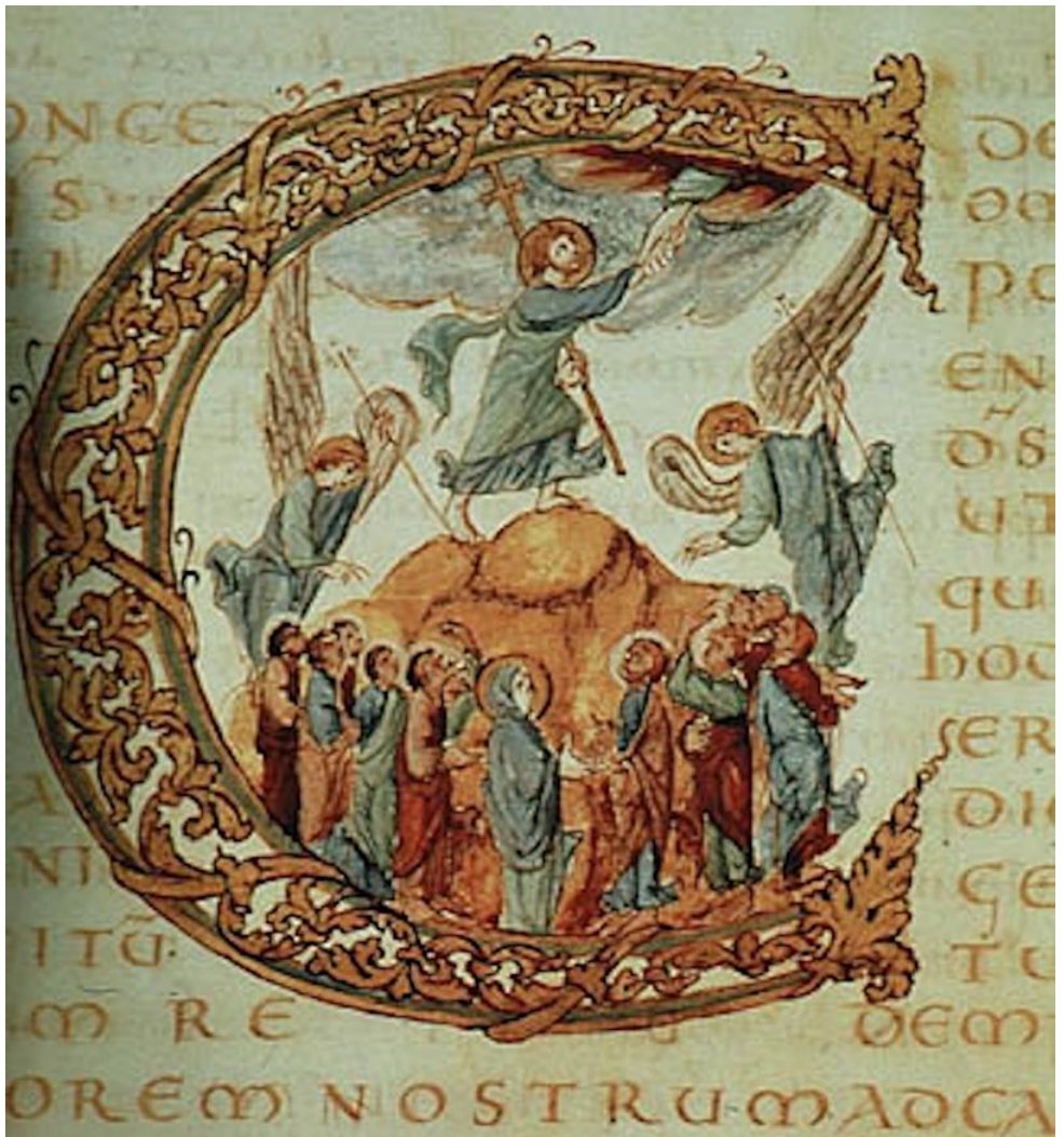
Drogo Sacramentarium, ca. 850.